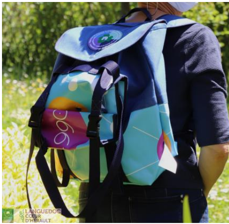
Sac à dos face avant