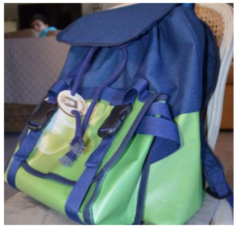
Sac à dos face arrière